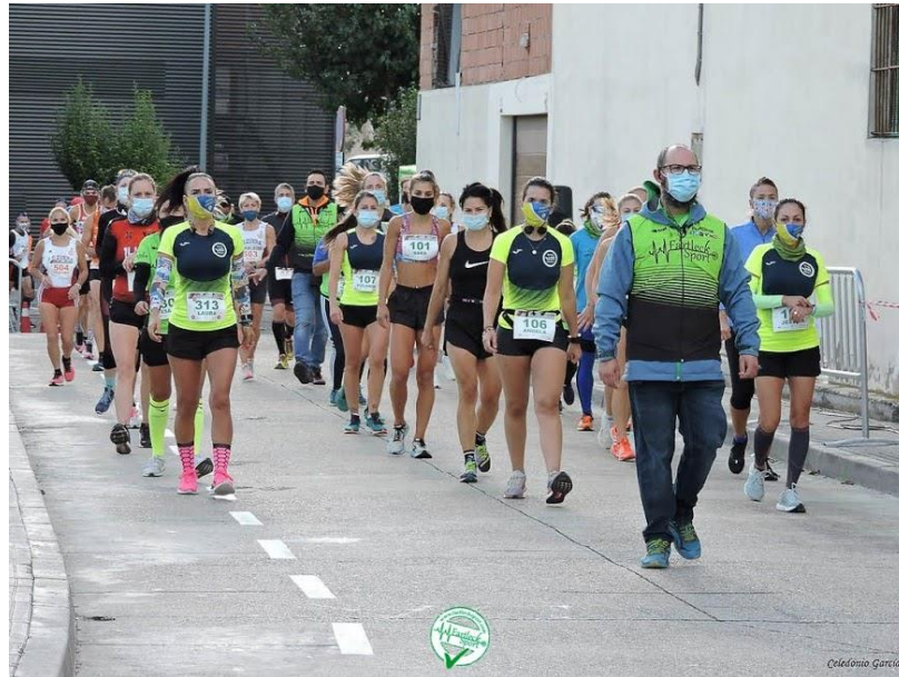
Cajón de salida de categoría femenina acercándose a la línea de salida guiado por personal de la organización. XL Subida al Santuario de la Misericordia de Borja. Octubre 2020.