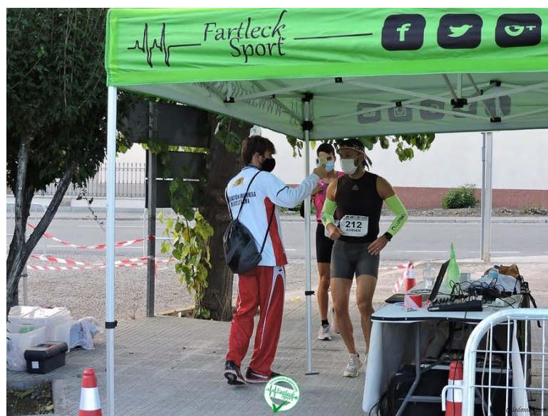
Juez FAA tomando temperatura. XL Subida al Santuario de la Misericordia de Borja. Octubre 2020.