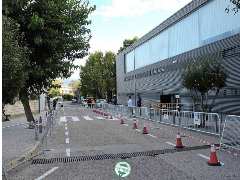
Cajones de salida vallados en XL Subida al Santuario de Misericordia de Borja. Octubre 2020.