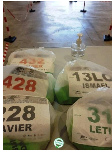
Bolsas del corredor individualizadas y gel hidroalcohólico para los participantes.

Subida al Santuario de la Misericordia de Borja. Octubre 2020.