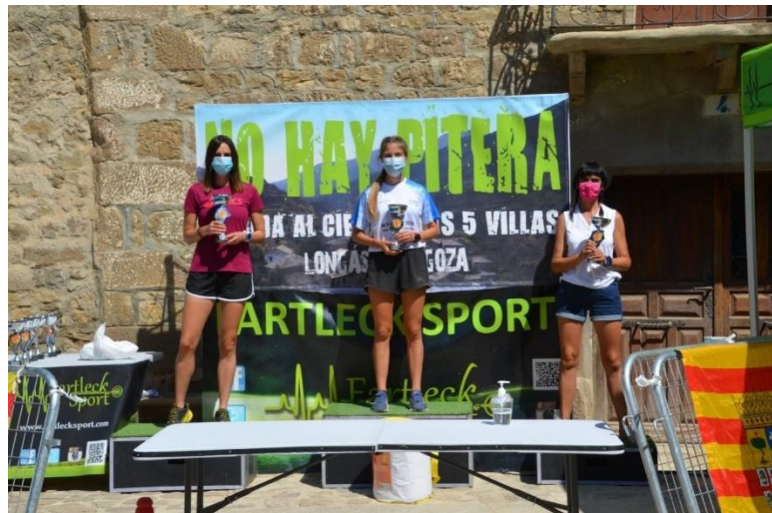
Entrega de trofeos IX Trail No hay pitera de Longás. Las premiadas respetan la distancia de seguridad, portan mascarillas y disponen de gel hidroalcohólico para lavarse las manos. Septiembre 2020.