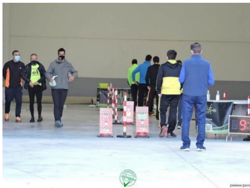
Recogida de dorsales en la XL Subida al Santuario de la Misericordia de Borja. Octubre 2020.