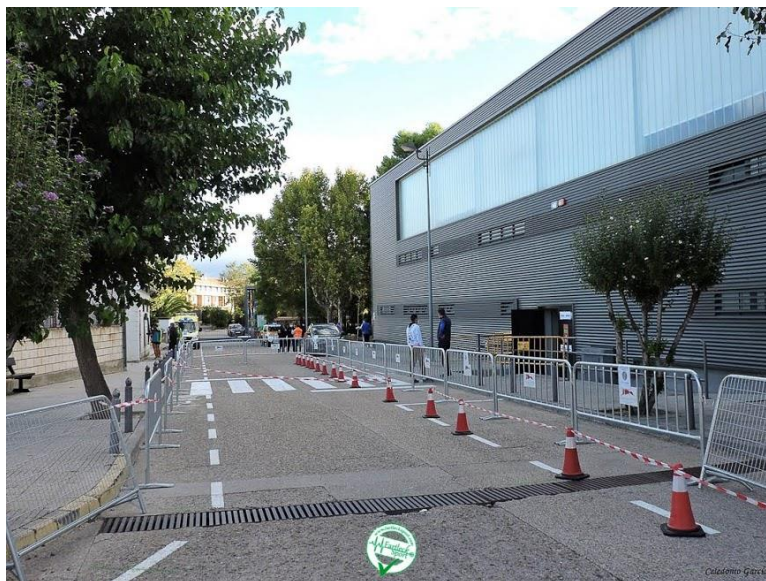
Cajones de salida vallados en XL Subida al Santuario de Misericordia de Borja. Octubre 2020.