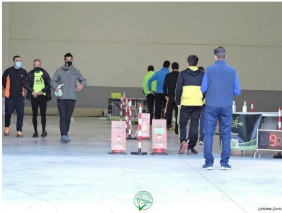
Recogida de dorsales en la XL Subida al Santuario de la Misericordia de Borja. Octubre 2020.