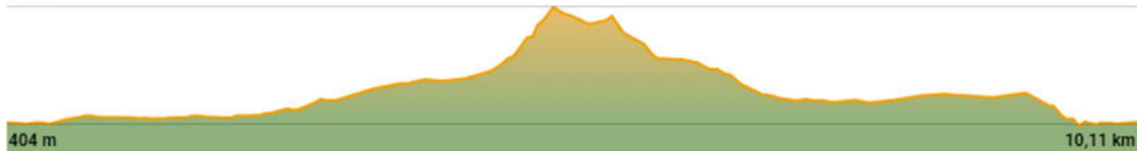
TABLA TÉCNICA TRAIL MUEL: CABEZO DE SAN BOROMBÓN