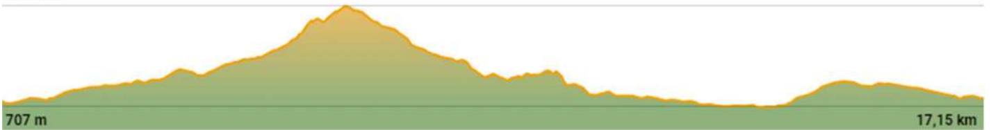
TABLA TÉCNICA VI TASTAVINS TRAIL 17K BY FARTLECK SPORT