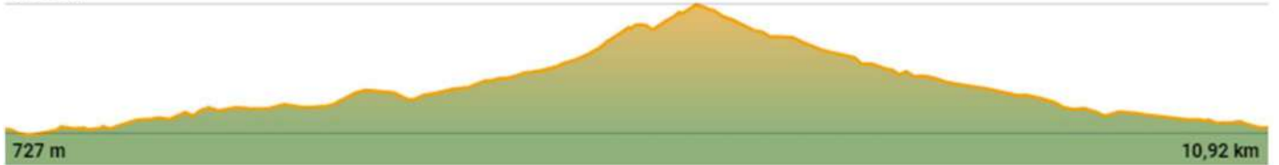
TABLA TÉCNICA VI TASTAVINS TRAIL 10K BY FARTLECK SPORT