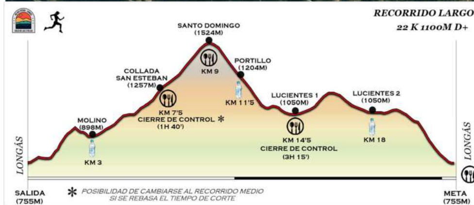
TABLA TÉCNICA XII TRAIL NO HAY PITERA LONGÁS BY FARTLECK SPORT