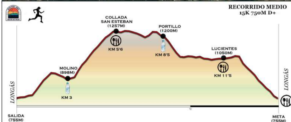
TABLA TÉCNICA XII TRAIL NO HAY PITERA LONGÁS BY FARTLECK SPORT