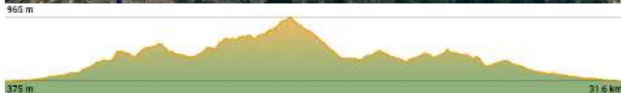
TABLA TÉCNICA XVI TRAIL MULARROYA BY FARTLECK SPORT