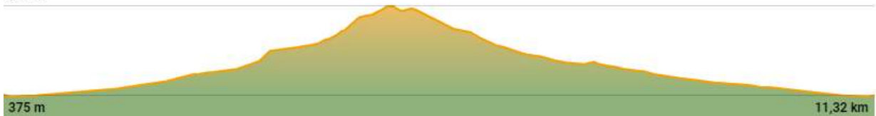
TABLA TÉCNICA XVI TRAIL MULARROYA BY FARTLECK SPORT